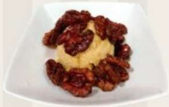
Helado con nueces