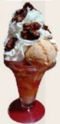
Postre de la casa