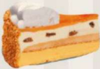
Tarta de Whisky