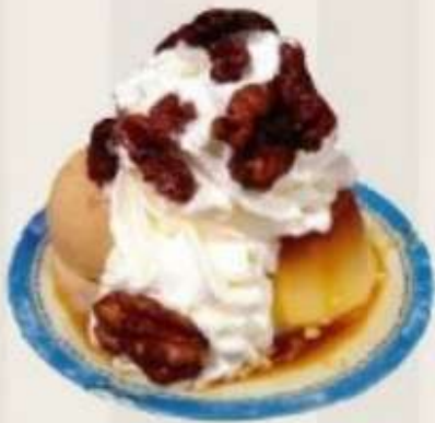
Flan con helado de nata y nueces