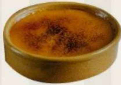
Crema Catalana Eggyolk & Caramel