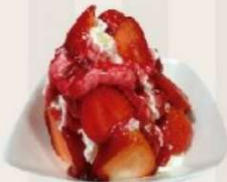
Fresas con nata