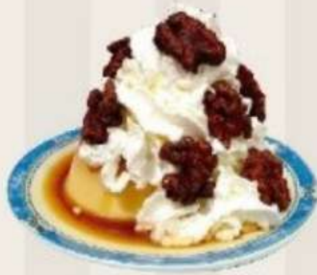
Flan con nata y nueces