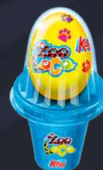
Huevo Kinder 4,95€