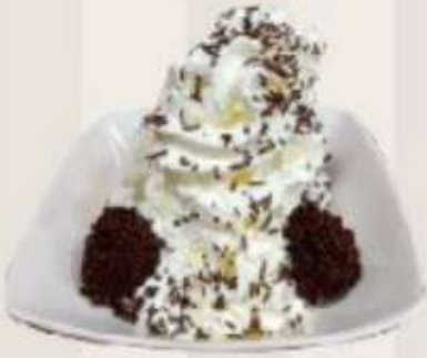
Trufitas con nata