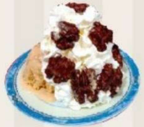
Helado con nata y nueces