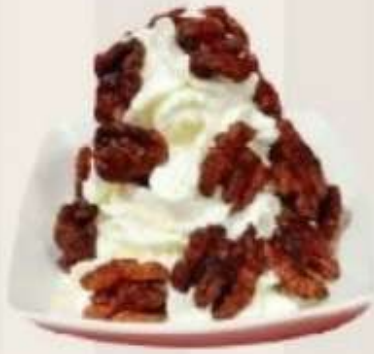
Nata con nueces